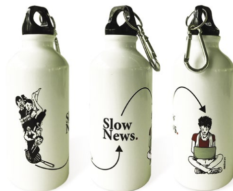
Borracce stampate da PressUP per Slow News

Abbiamo messo a punto una gamma già ricca