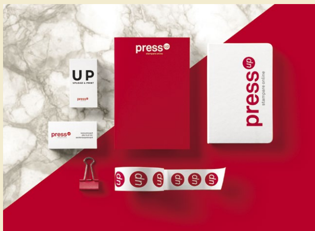
Gadget e cancelleria